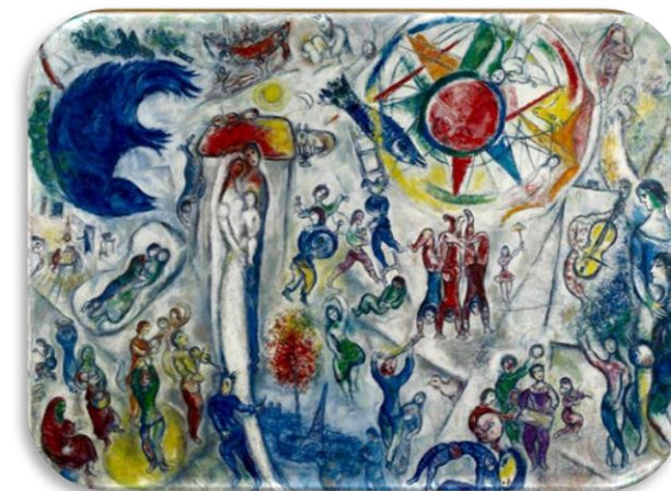
Marc Chagall, La mia vita , 1964

"Alla luce dell' AUTOBIOGRAFIA di Sant' Ignazio di Loyola"